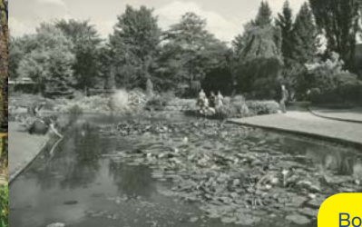
Botanische Tuin / Stadspark